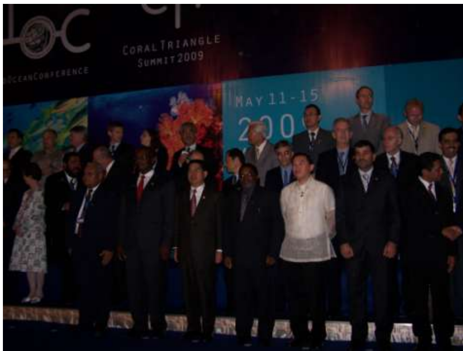
Menteri- menteri Negara Maritim menghadiri Mesyuarat Tertinggi Persidangan Lautan Dunia (WOC) sempena Sidang Kemuncak Inisiatif Segitiga Terumbu Karang (CTI) yang diadakan di Pusat Konvensyen Grand Kawanua Manado, Sulawesi Utara, Indonesia.