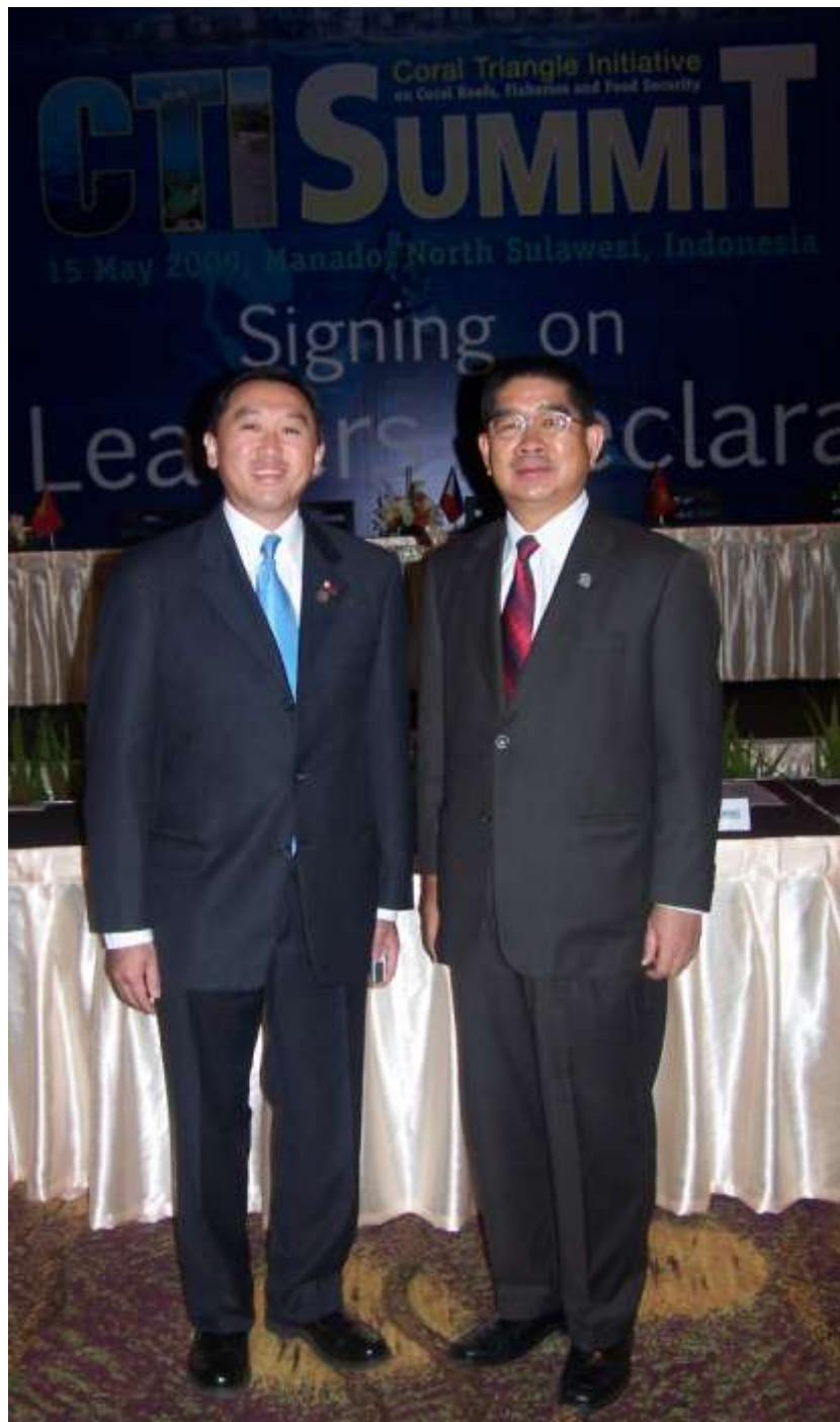
YB Datuk Minister of MOSTI with the Minister from Philippines