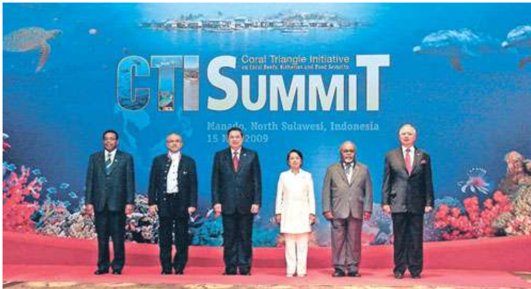
Sidang Kemuncak Segitiga Terumbu Karang (Coral Triangle Initiative) dan Persidangan Lautan Sedunia (WOC) 2009 di Manado, Sulawesi mengumpulkan 6 ketua-ketua negara CTI termasuk 120 negara maritim yang lain.